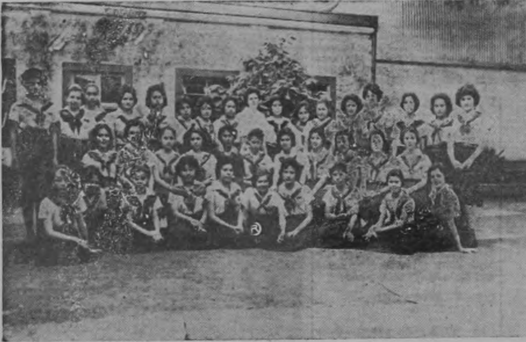
Grupo de las niñas del sexto grado A de la Escuela Vitalia Madrigal, quienes han terminado este año su primera enseñanza

Sexto Grado A de la Escuela Vitalia Madrigal